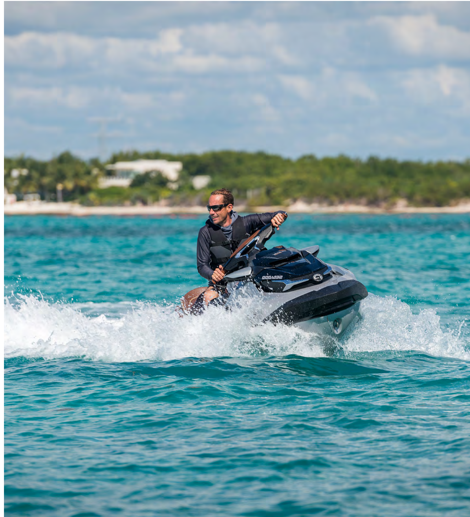
Sea-doo jet ski

Prices include taxes. Certain activities may not be recommended for non-swimmers, pregnant women or passengers with certain health conditions. Minimum age limits may apply. Use of sun-protecting attire is recommended. Environmentally friendly sunblock is available for sale at the Dive & Water Sports Center. Preservation and respect for the natural environment is mandatory. All experiences are subject to weather conditions and availability.