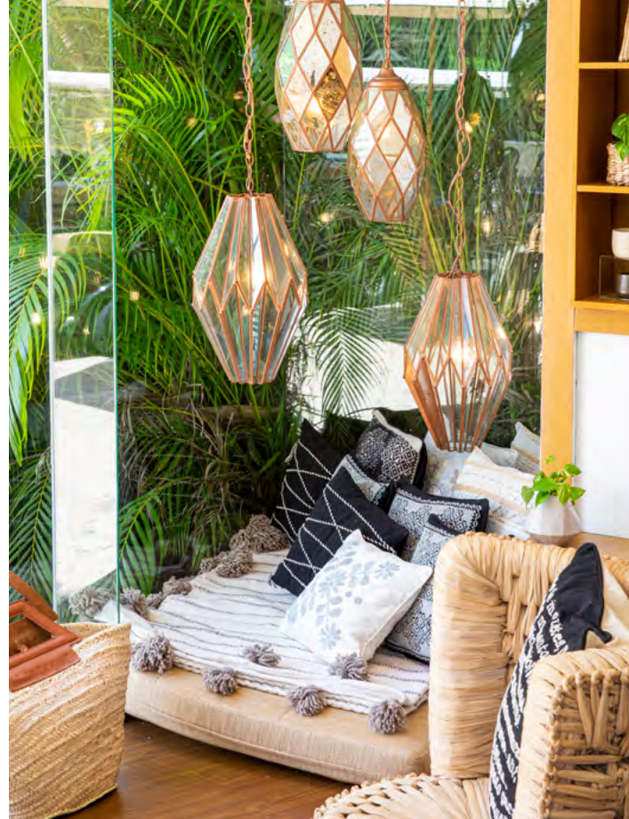
Rosewood Artisan Boutique