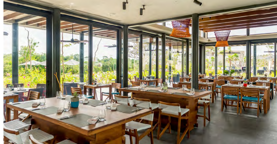
Cocina Milagro by Andaz

Seaside pool and relaxing views to the Caribbean offers seafood specialties and handcrafted cocktails. Open: Breakfast, Lunch & Dinner