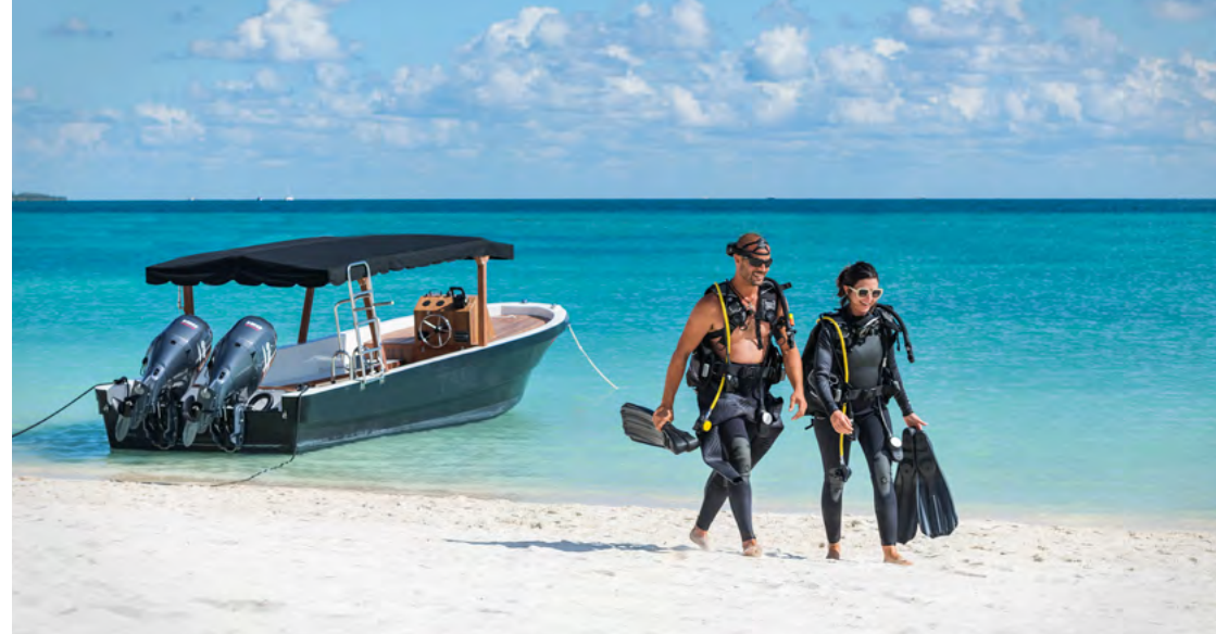
High-End Diving Equipment

Develop new skills as a diver in search of deeper adventures with PADI methods. Train with the best divers of the Riviera Maya. Try our top-quality equipment and explore remote places of the Caribbean Sea. Visit wrecks, dive with current, navigate with instruments and many more amazing diving experiences.