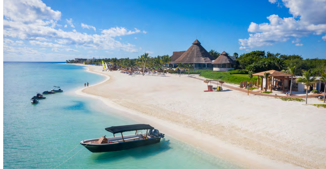
Mayakoba Dive & Water Sports Center

Swim like a dolphin atop the water or beneath the surface on the world's fastest underwater scooter.