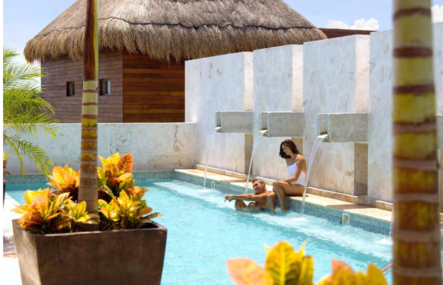
Willow Stream Spa by Fairmont

The Willow Stream Spa Fitness Center is fully equipped with premier cardio and strength equipment, as well as an aerobic floor and media wall. Certified trainers are standing by to provide insightful instruction to enhance your fitness experience or provide personalized workout programs.