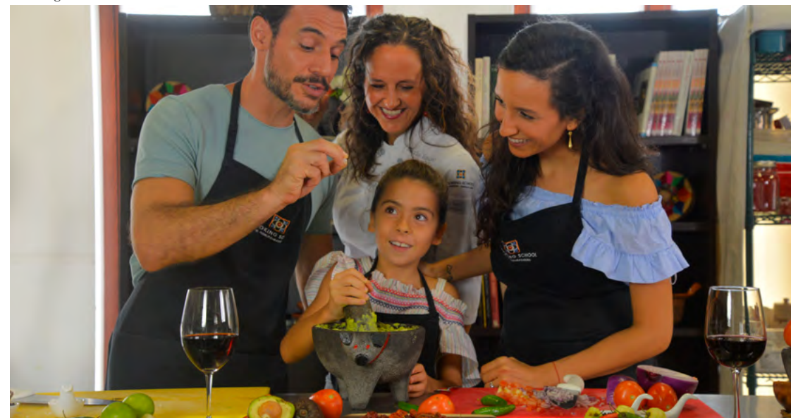
Cooking School at El Pueblito