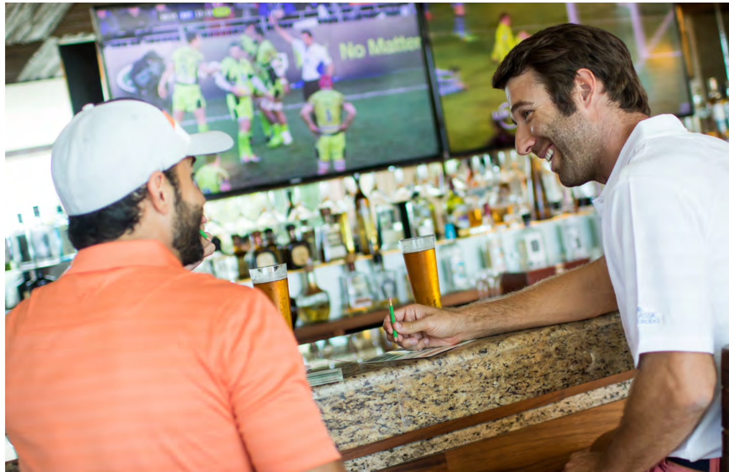
Koba at El Camaleón