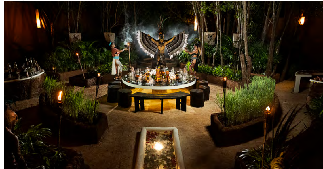
Haab by Banyan Tree