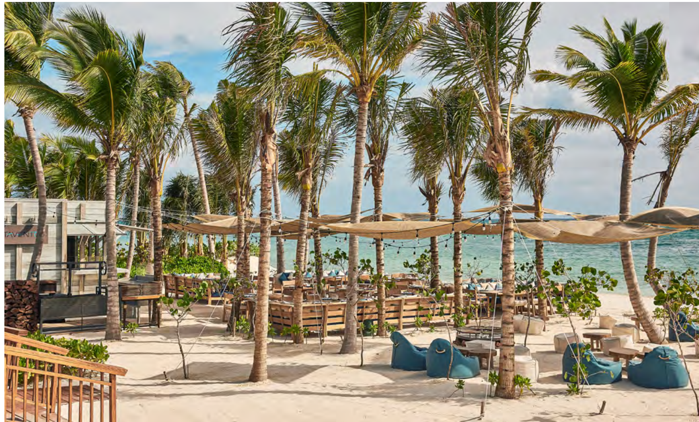
Sotavento by Andaz

Resembling a shipwreck right at Mayakoba's beach, enjoy the most exquisite luxury Mediterranean barefoot experience.