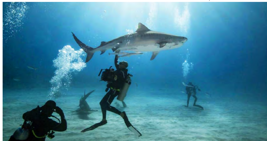
The Mayakoba Extreme: Shark Diving