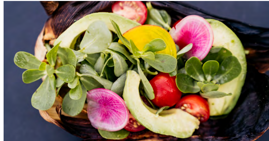
Beach Food Fest by Rosewood