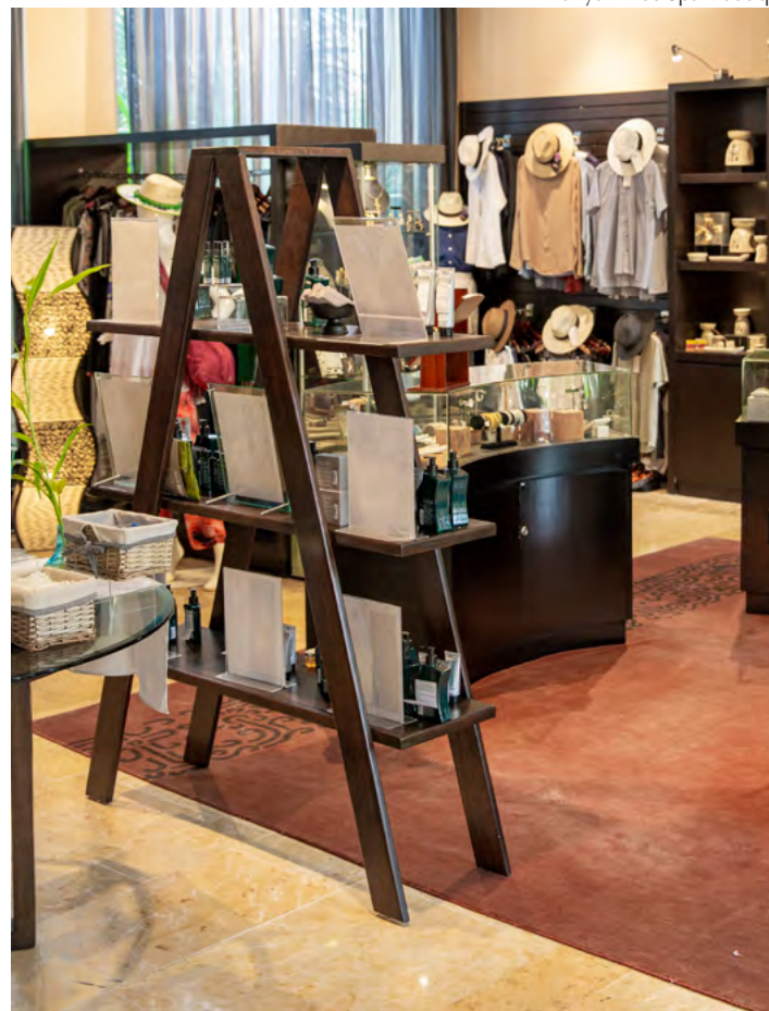
Banyan Tree Spa Boutique