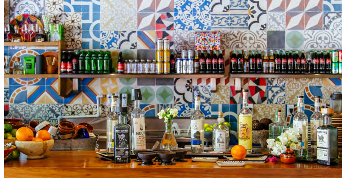
La Fondita at El Pueblito

Discover the flavors of Mexico by enjoying an interactive cooking class provided by the acclaimed chefs of Mayakoba. Open: Reservation Only