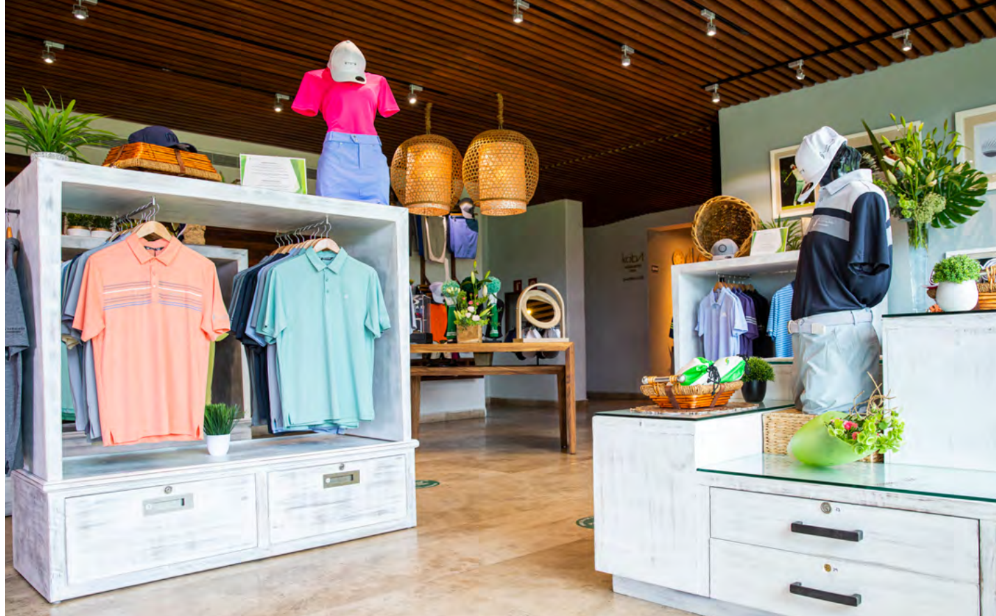
El Camaleón Pro Shop