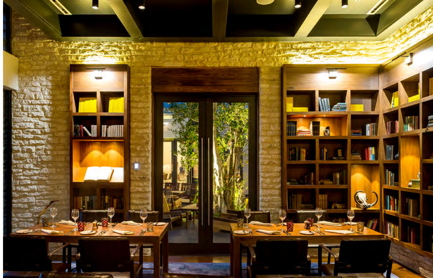
Casa Amate by Andaz

Rosewood Mayakoba's newest experience, the Colonial Yucatan Peninsula bar offers contemporary Mayan cocktails and shareable Mediterranean-style small plates.