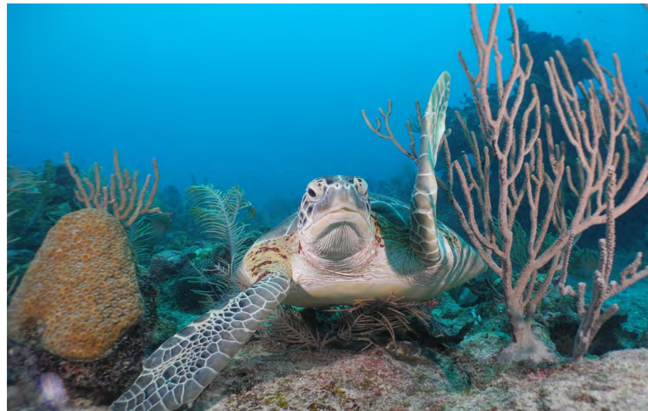
The Mayakoba Explorer