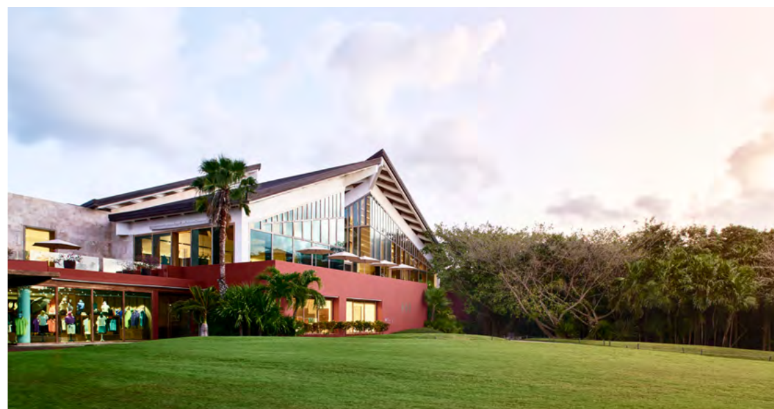
Koba Club House at El Camaleón