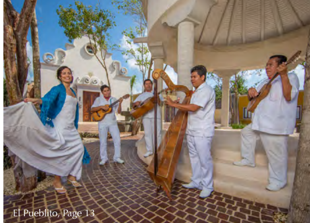
El Pueblito, Page 13