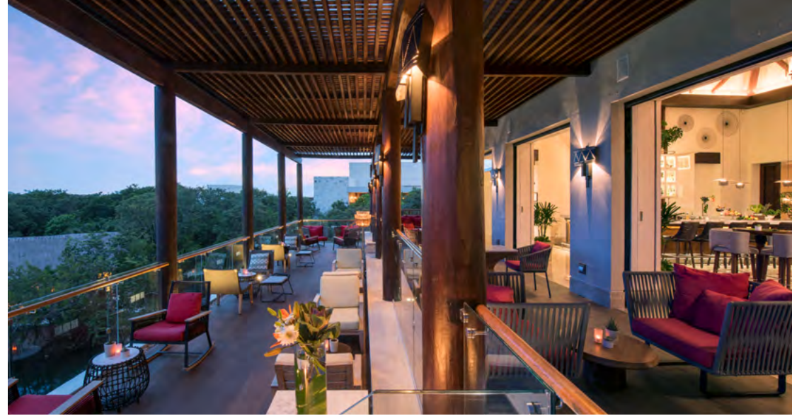
Hix by Fairmont