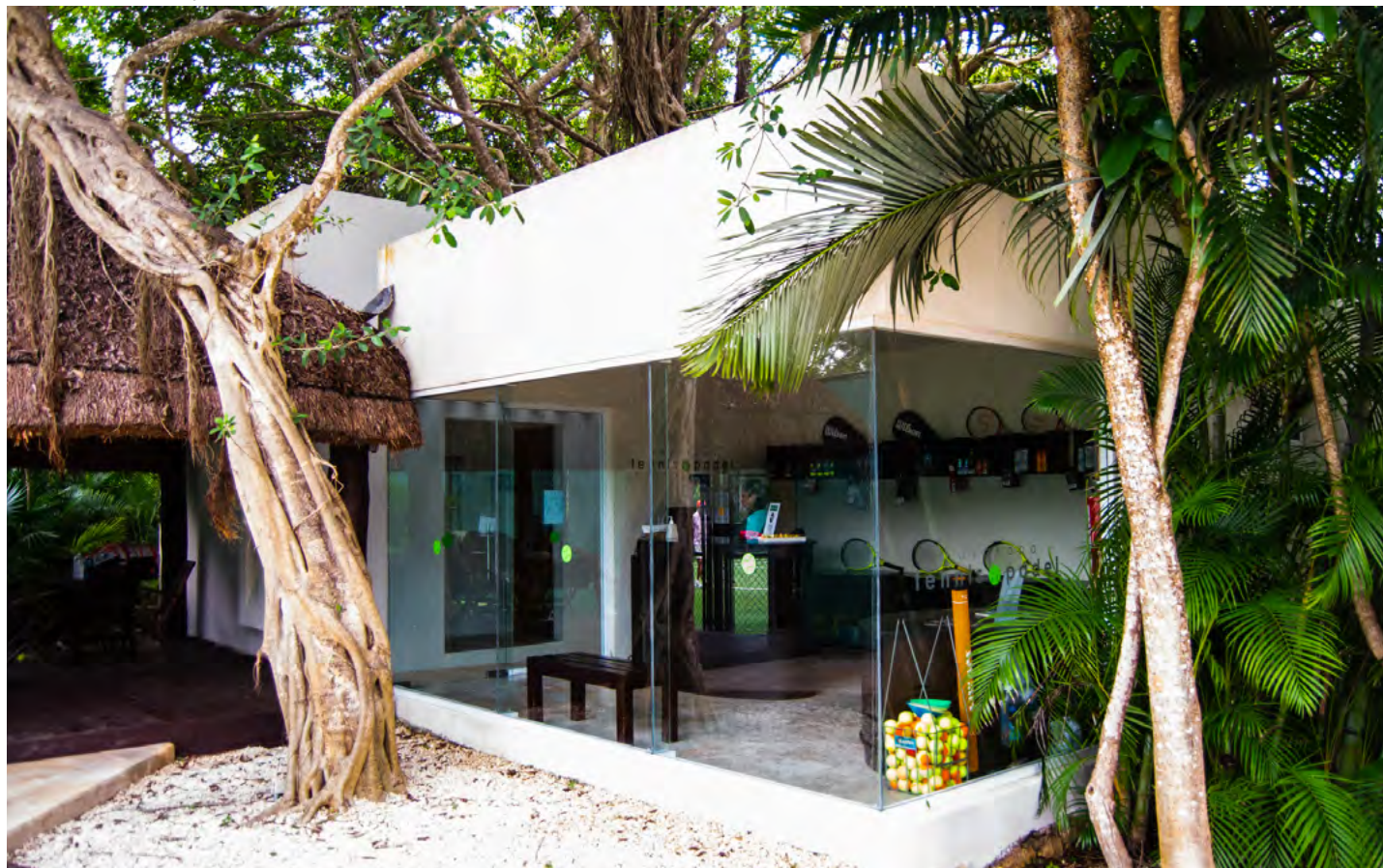
Tennis Center Pro Shop