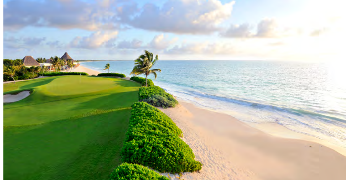
Hole 15, El Camaleón