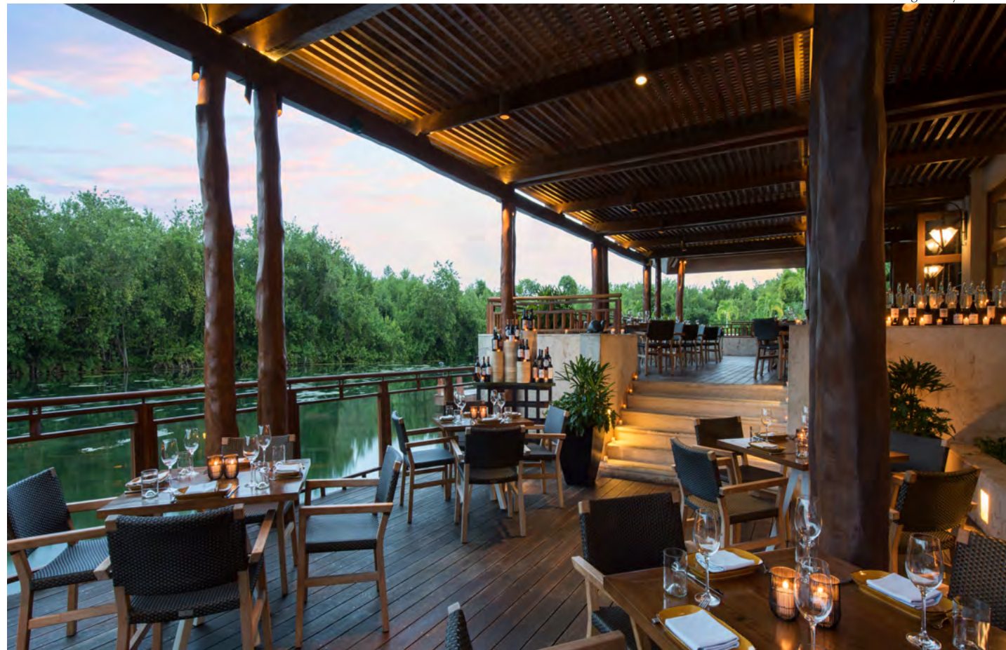
La Laguna by Fairmont