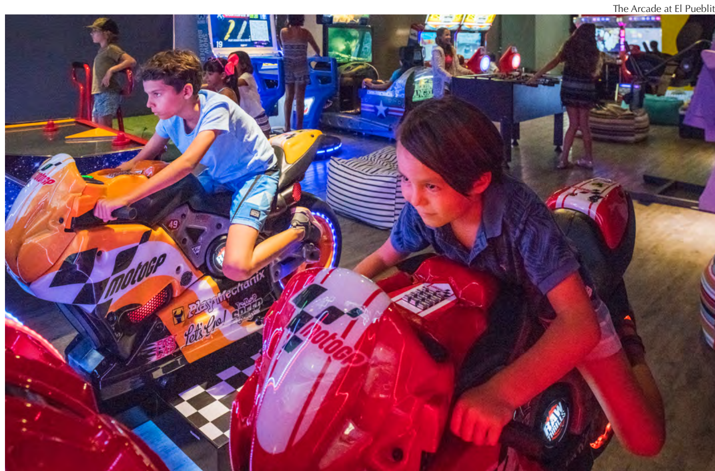
The Arcade at El Pueblito