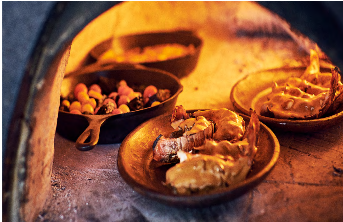
La Ceiba by Rosewood