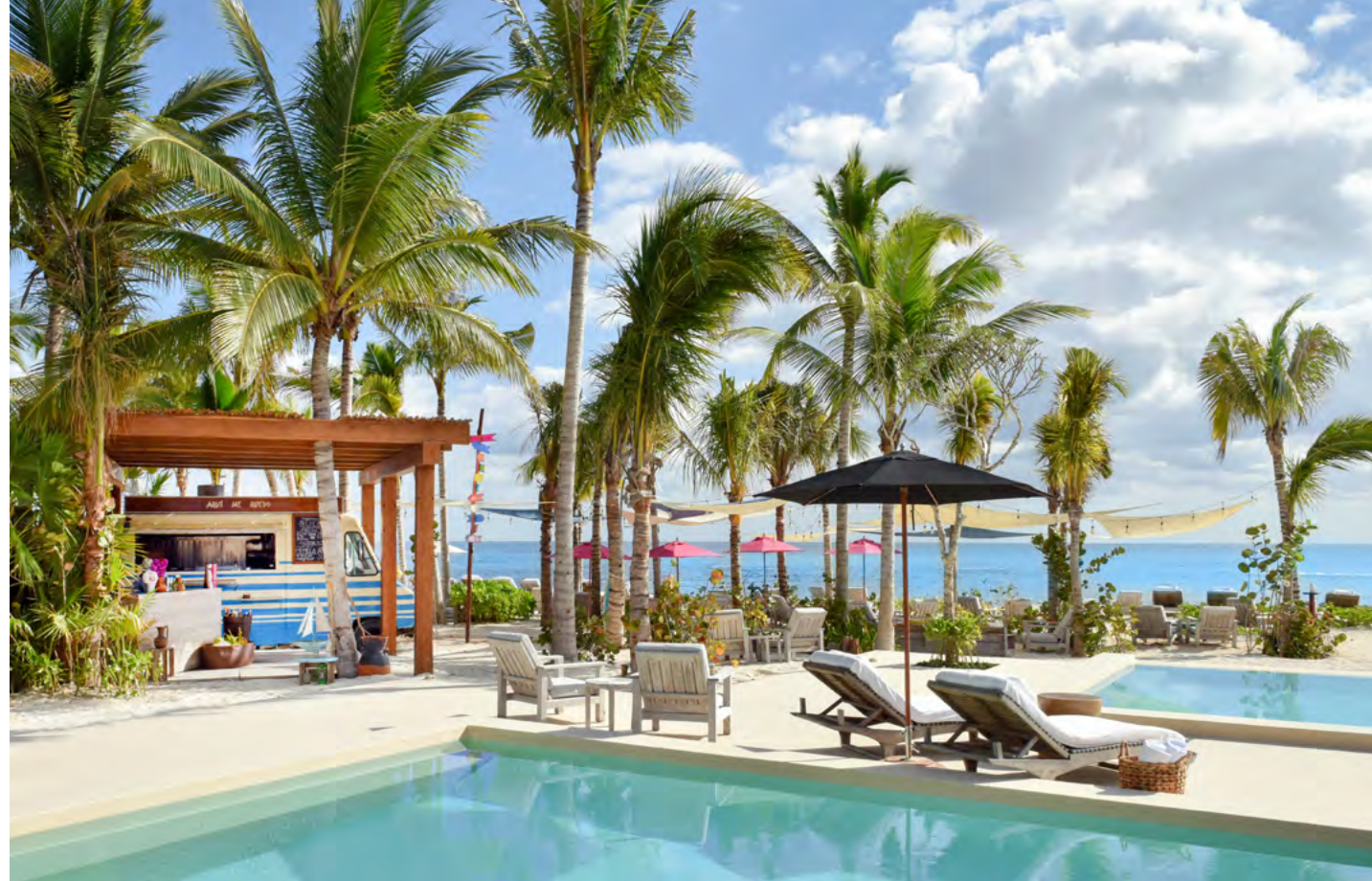
Aquí Me Quedo by Rosewood

Mexican traditional street food and entries in a relaxed ambiance and beautiful terrace.