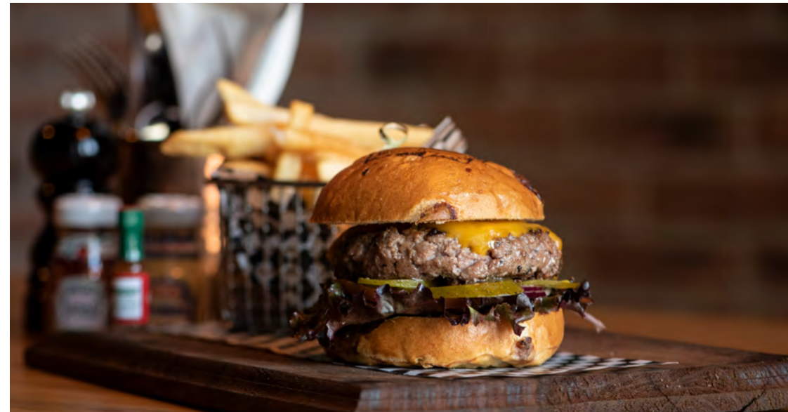
The Burguer Shop at El Pueblito