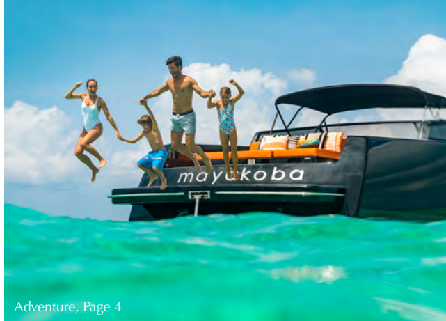
Adventure, Page 4