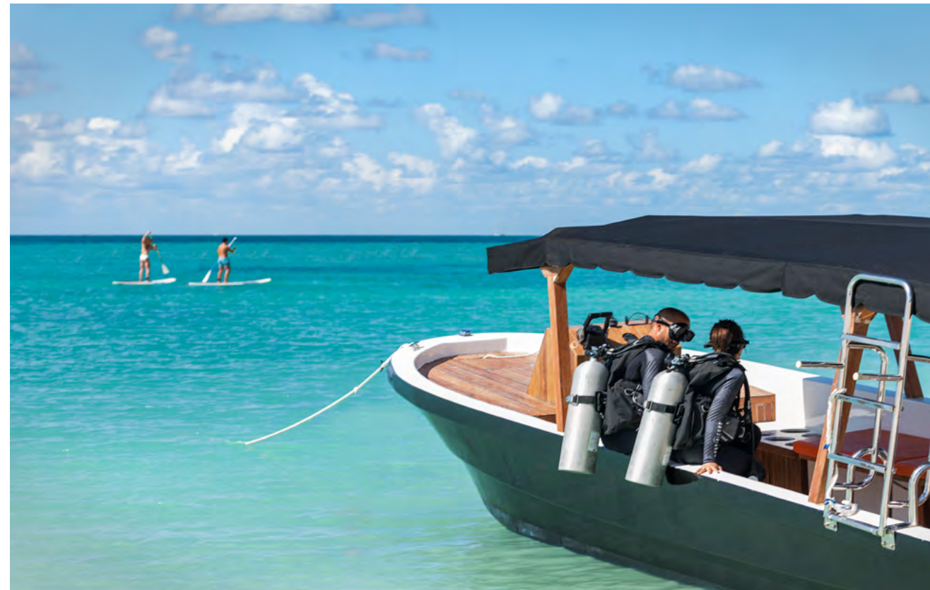
Mayakoba Diving Vessel

A 50% deposit is required at booking, which is refundable up to 24 hours before the reservation, pending notice. Cancellations based on weather conditions are fully refundable when port is closed to navigation by the authorities. No shows and cancellations within 24 hours will be fully charged. Last minute excursions are available. All excursions are subject to change due to weather conditions. Destinations may change upon navigability.