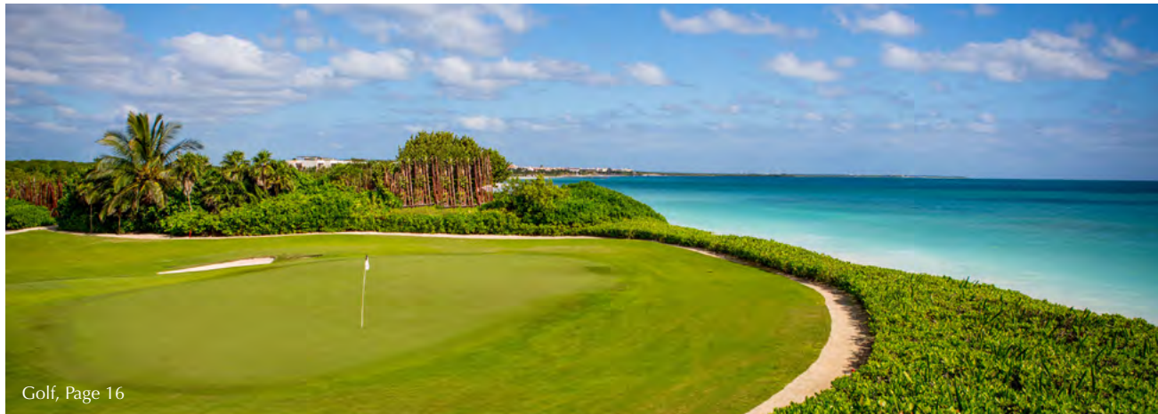
Golf, Page 16