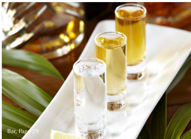
Bar, Page 29