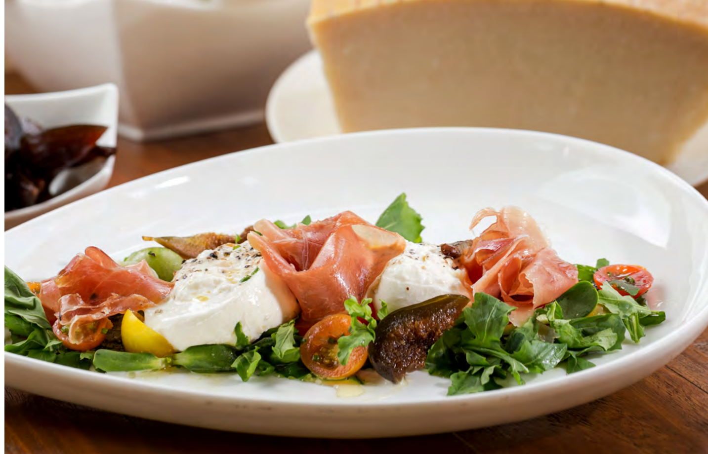
Cello by Banyan Tree

Italian and mediterranean cuisine with a romantic low light atmosphere and amazing views to the lagoon and Fairmont's main dock.