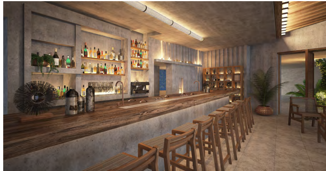
Zapote Bar by Rosewood