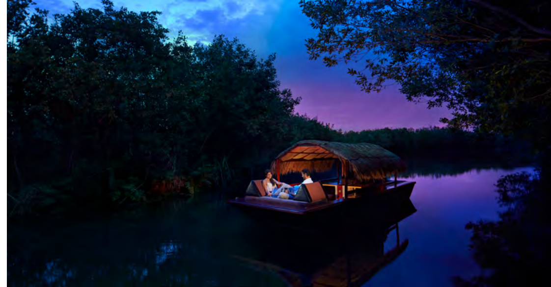
Ixchel by Banyan Tree

at Rosewood Mayakoba Al Fresco dinner by the sea with a menu drawn from Mexico's Southern Pacific coast.