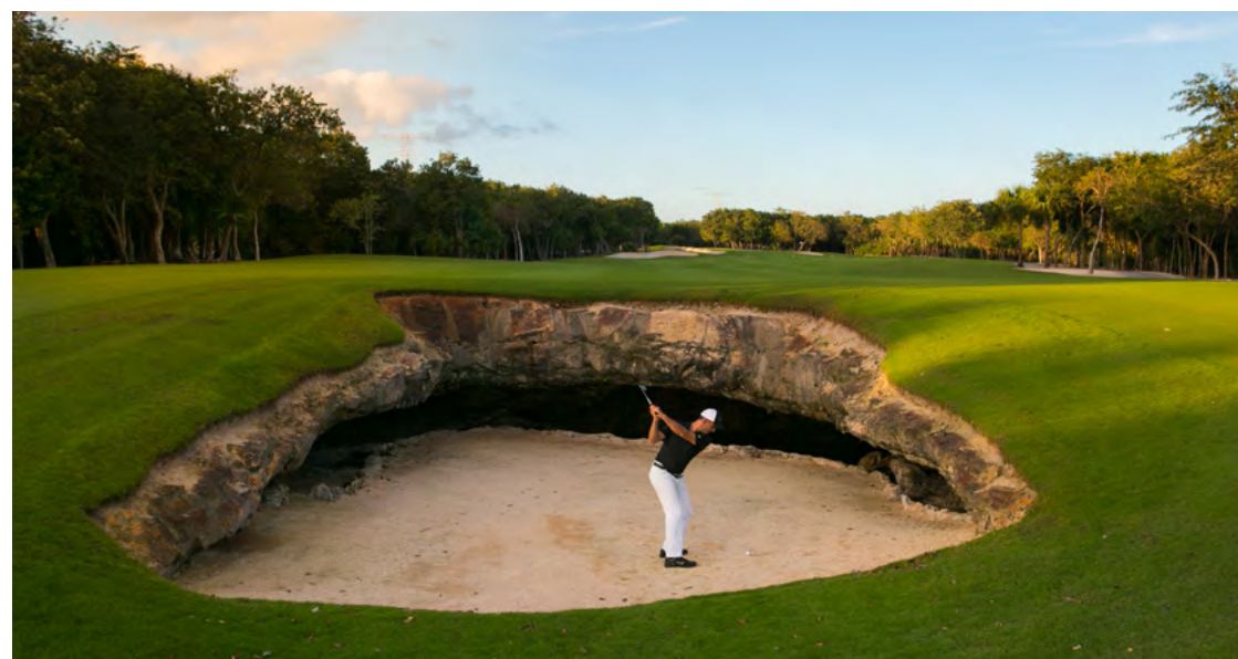
Hole 7, El Camaleón