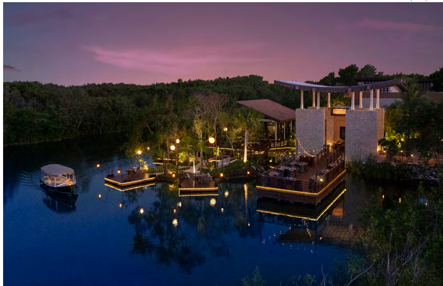
Saffron by Banyan Tree