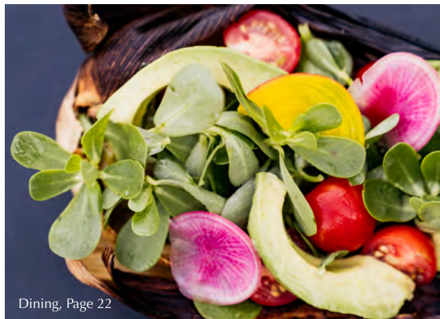
Dining, Page 22