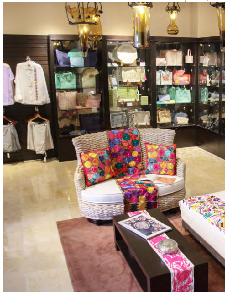
Gallery at Banyan Tree