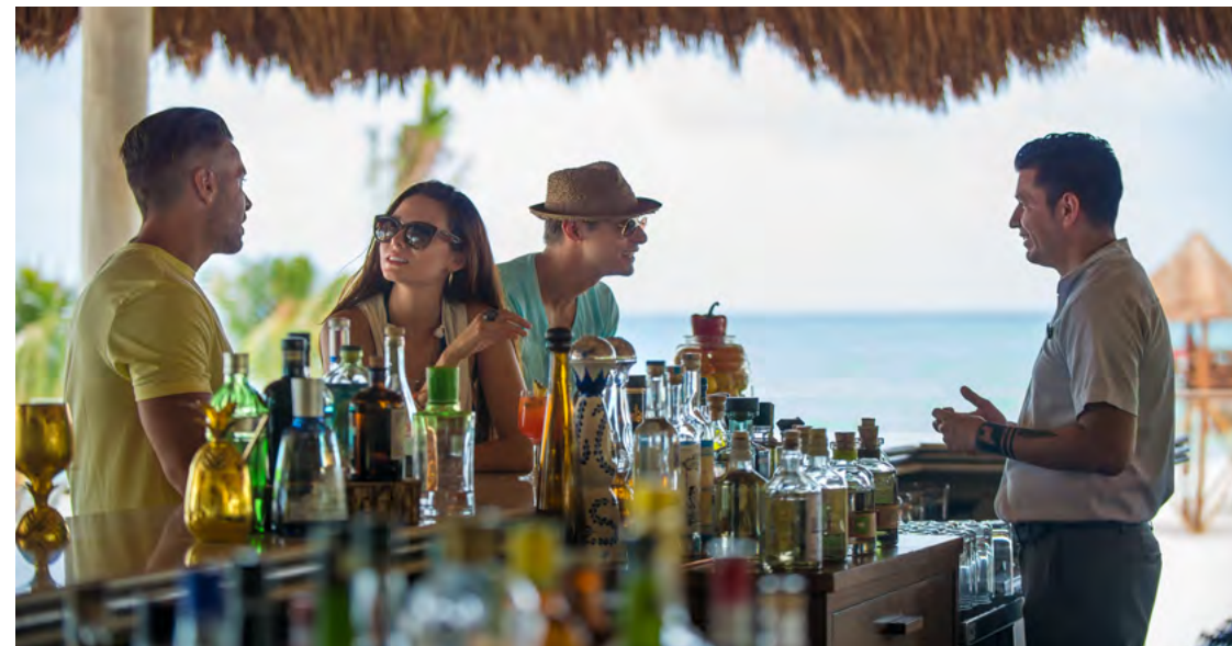
Brisas by Fairmont