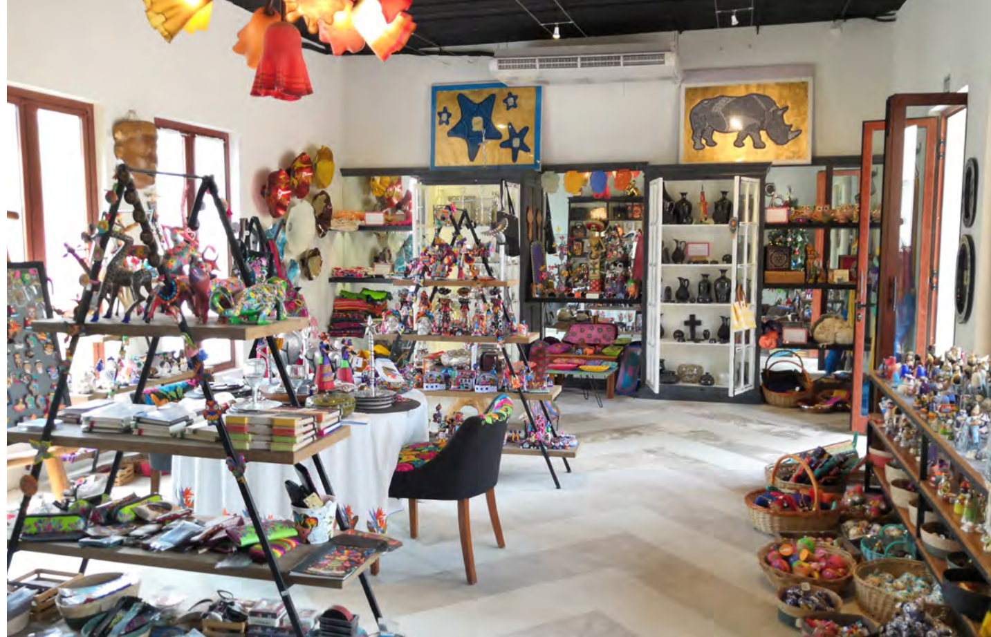
D' Origen Boutique at El Pueblito

Explore real estate offerings at Mayakoba, including the Rosewood Residences private villa collection and Fairmont Residences full and fractional-ownership collections.