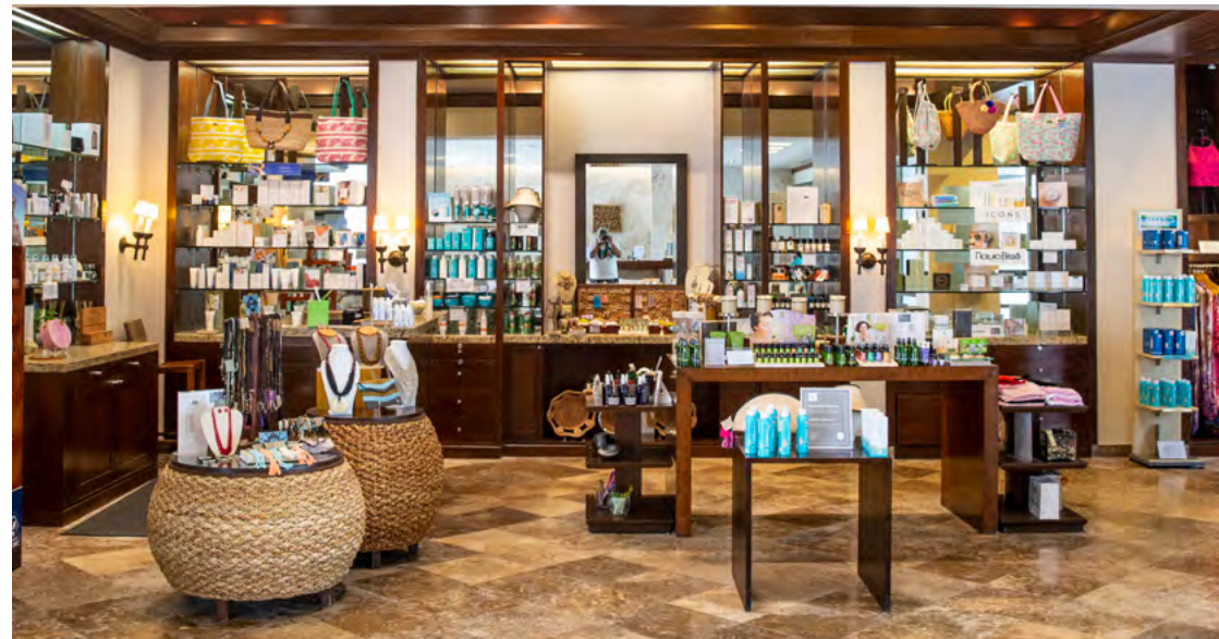
Fairmont Spa Boutique