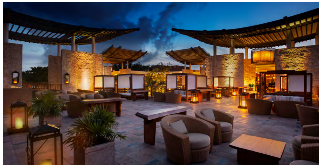
La Copa by Banyan Tree