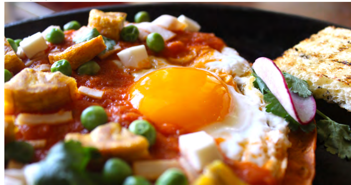
Oriente by Banyan Tree