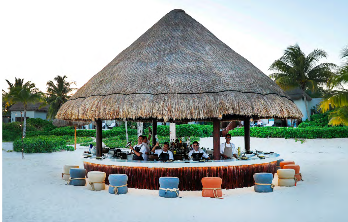
Ki' Beach Bar & Korean BBQ by Fairmont

Vibrant beach bar which transforms into a tabletop-grill Korean BBQ.